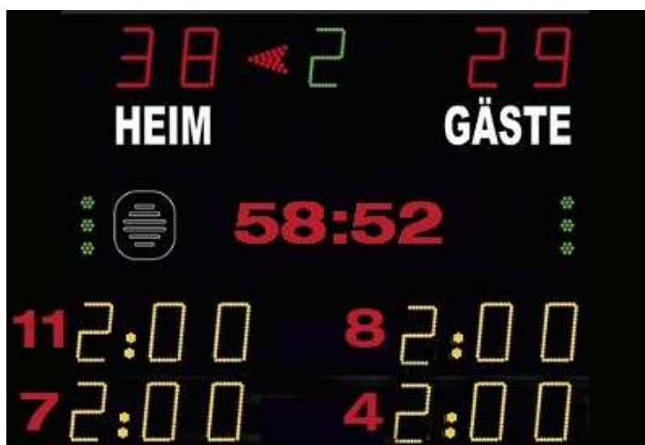
Abbildung 1: Beispiel Anzeigetafel

Das Anzeige-System in der Spielstätte muss eine öffentliche Zeitmessanlage sein, die von allen Zuschauerplätzen und insbesondere vom Zeitnehmertisch ohne Einschränkungen eingesehen werden kann. Werden auf der Anzeigetafel Zeitstrafen angezeigt, so müssen mindestens zwei Hinausstellungen pro Verein inkl. Spielnummer und Strafzeit (siehe Abbildung 1) angezeigt werden können. Sollte dies nicht möglich sein, so ist bei Hinausstellungen die Zeit des Wiedereintritts inkl. Spielnummer jeweils auf einem Vordruck in Papierform einzutragen und sichtbar anzubringen.